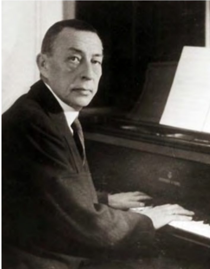
Sergei Rachmaninoff (1873-1943)

El Banco de la República invita a los participantes de la convocatoria a que voluntariamente incluyan en sus propuestas de repertorio obras de compositores a quienes en 2023 se les conmemorarán sus aniversarios: